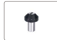
小V形台(选配), 适用于直径2~4mm的圆柱工件