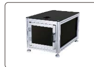
硬度计工作台(选配)