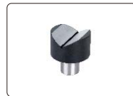
V形台(标配), 适用于直径4~60mm的圆柱工件